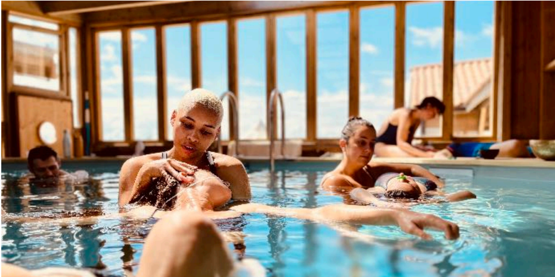
Dynamique stillness, aquatic fulcrum, et état modifié de conscience

En ostéopathie, écouter, regarder et toucher un patient nous renseigne sur ce qui a créé son état . L'expression de cet état renseigne notre diagnostic . Alors s'invite le processus de créativité, de traitement qui entreprend de modifier l'état.